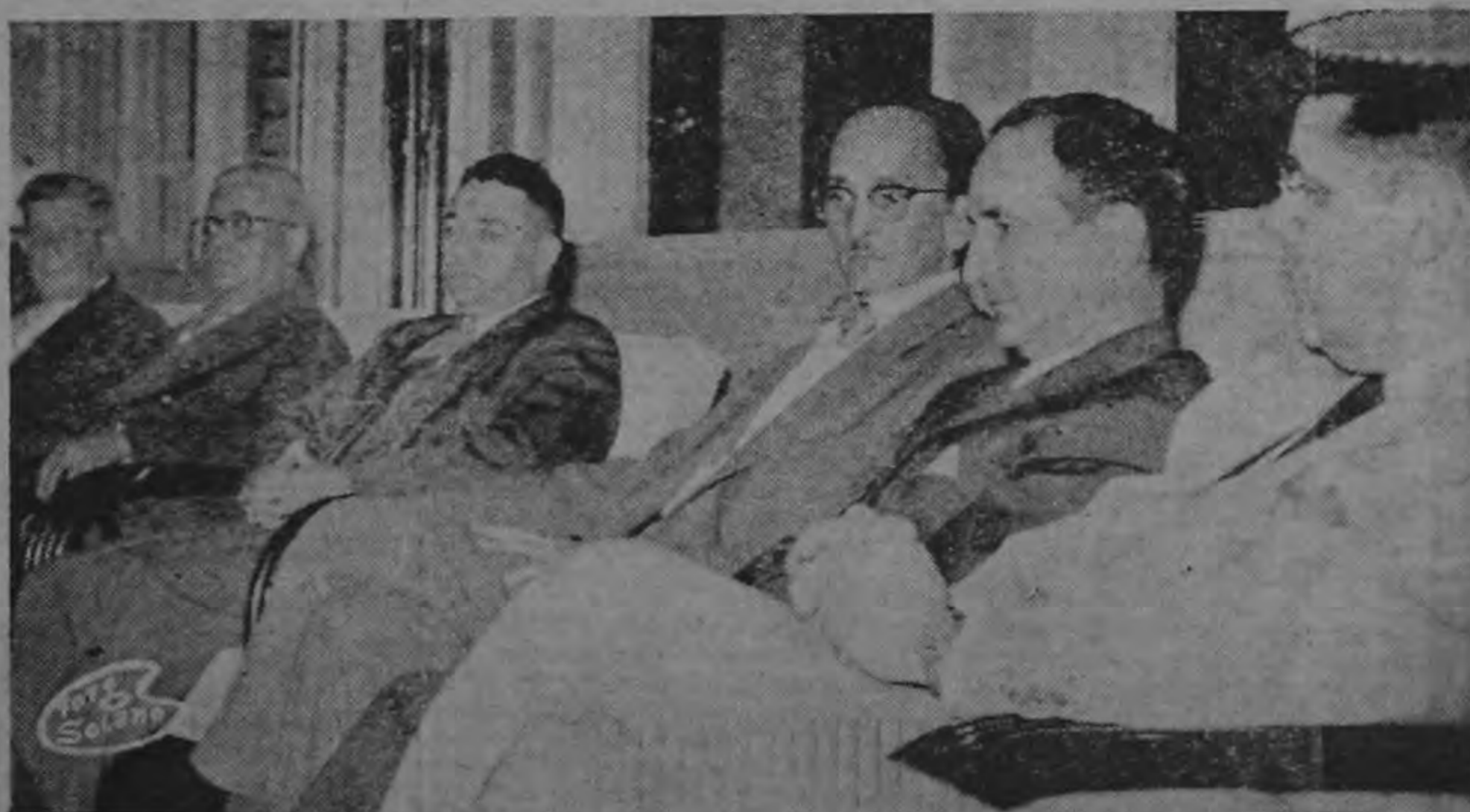
Ayer en la tarde visitaron al Presidente de la República, los señores Magistrados de la Corte Suprema de Justicia, con el fin de tener un cambio de impresiones. En la gráfica aparece un grupo de los distinguidos juristas, cuando se apartan cortadamente.