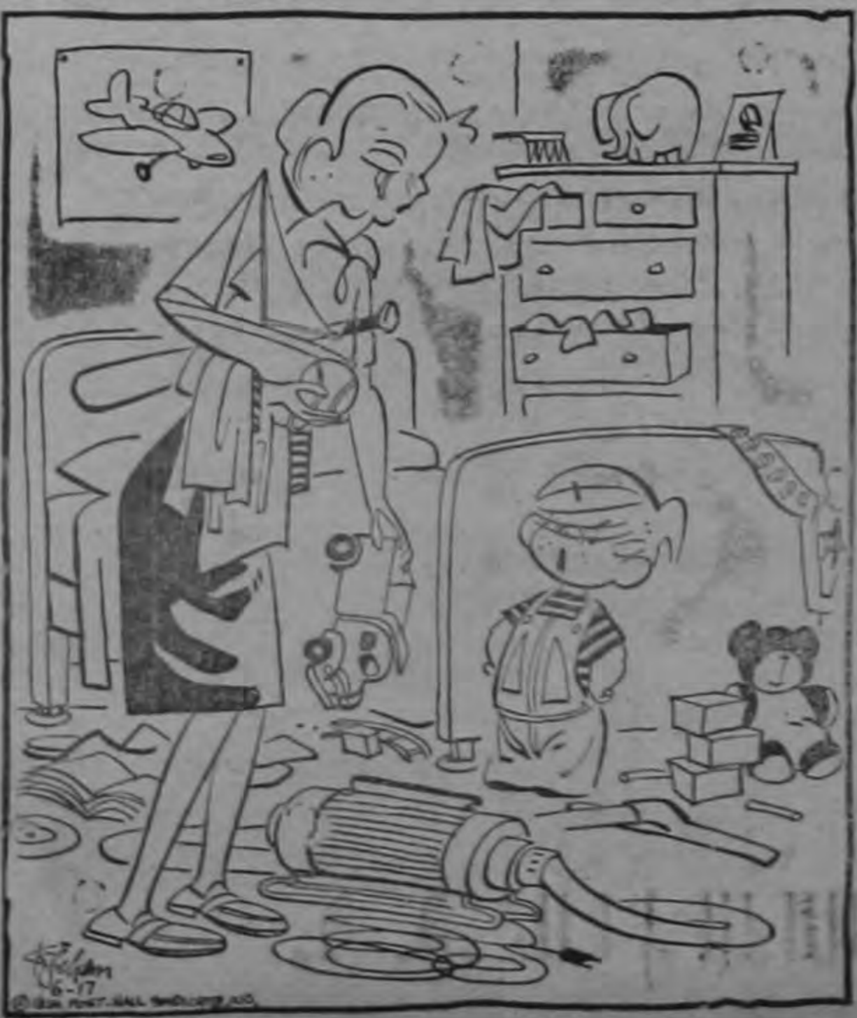
—Vaya, mamá! No haces más que desarréglar mi cuarto!